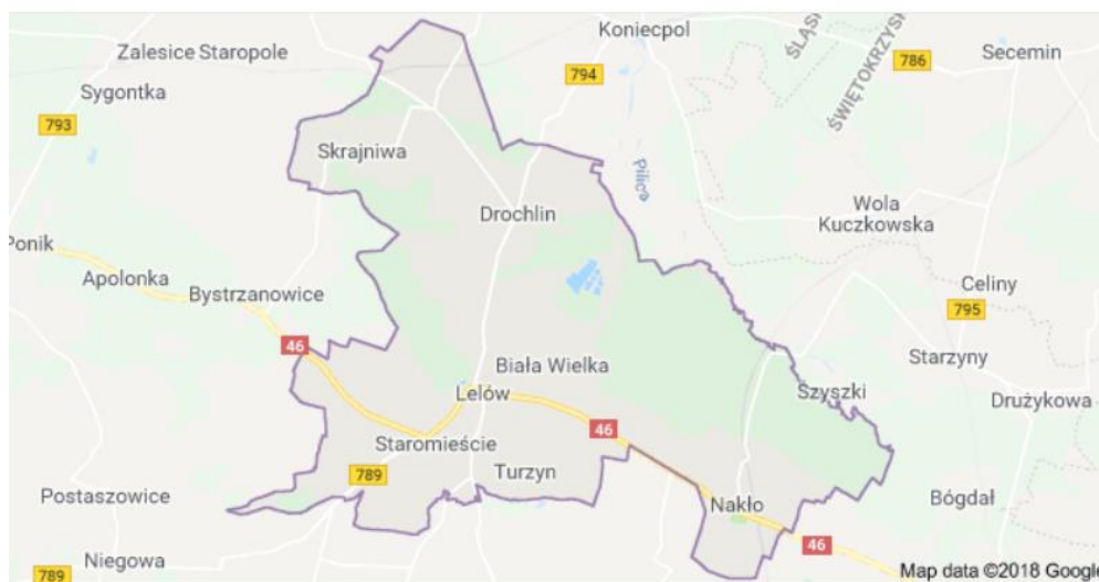
Rysunek 1. Mapa Gminy Lelów

Szczegółowa lokalizacja i inne dane dla danej lokalizacji zostały przedstawione w załączniku do PFU.