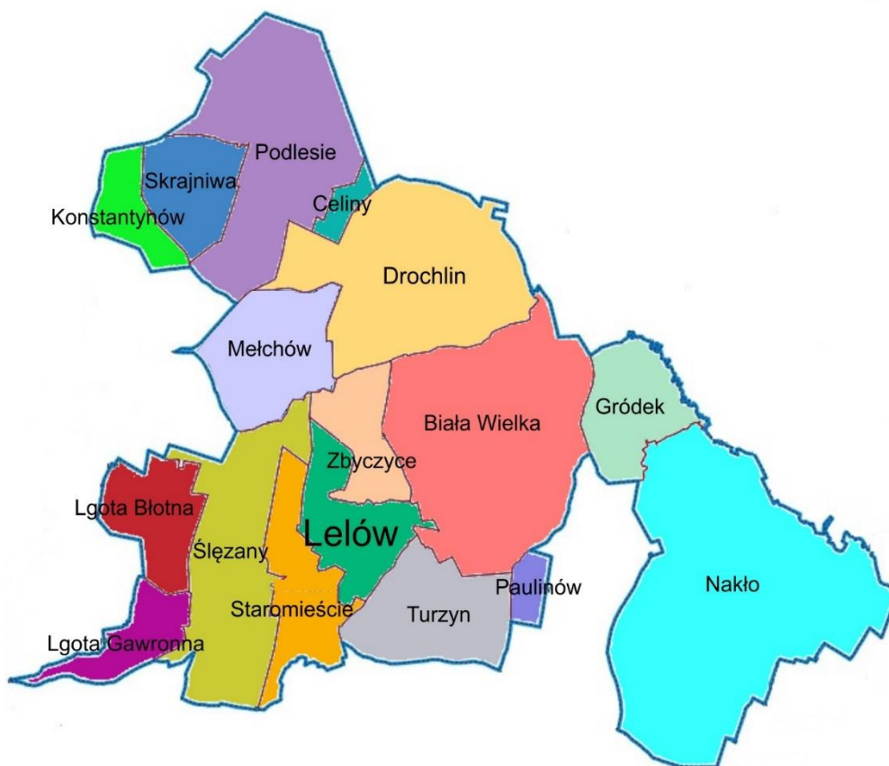
Powierzchnia sołectw gminy Lelów w ha

Na terenie gminy utworzono 17 jednostek pomocniczych – sołectw, odpowiadającym nazwom i w granicach obszarów obrębów geodezyjnych.