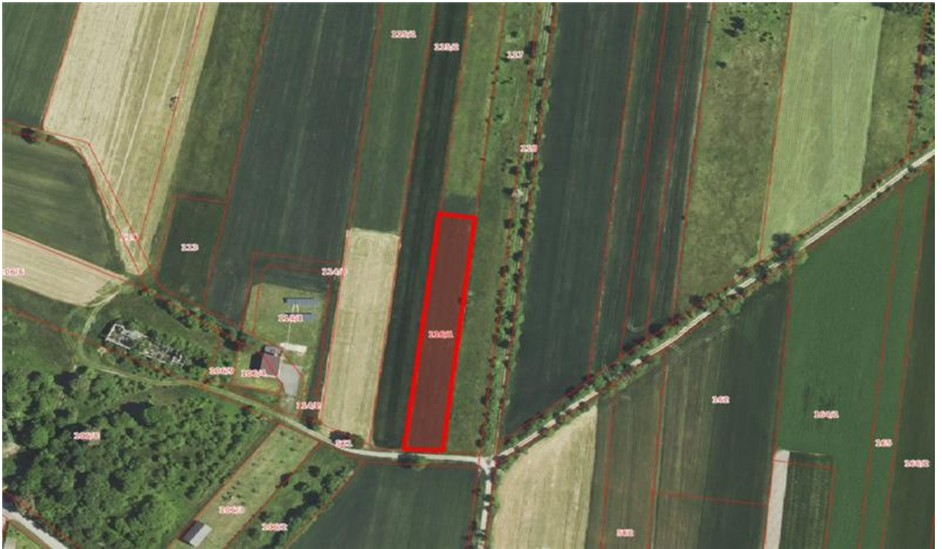
Działka o nr ewid. 116/1 o pow. 0,3000 ha obręb Melchów

Załącznik do uchwały Nr ..... Rady Gminy Lelów z dnia 9 lutego 2023 r.