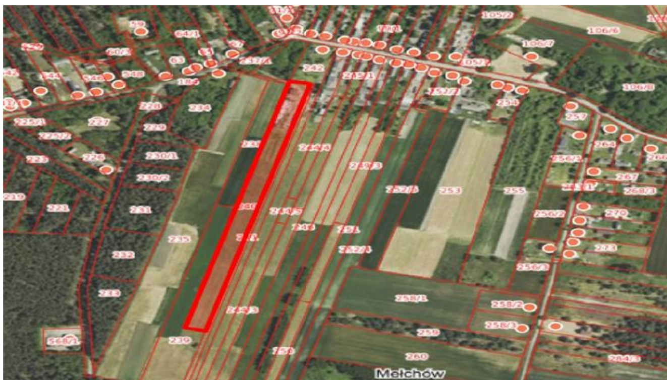
Działka o nr ewid. 240 o pow. 1,1900 ha obręb Melchów