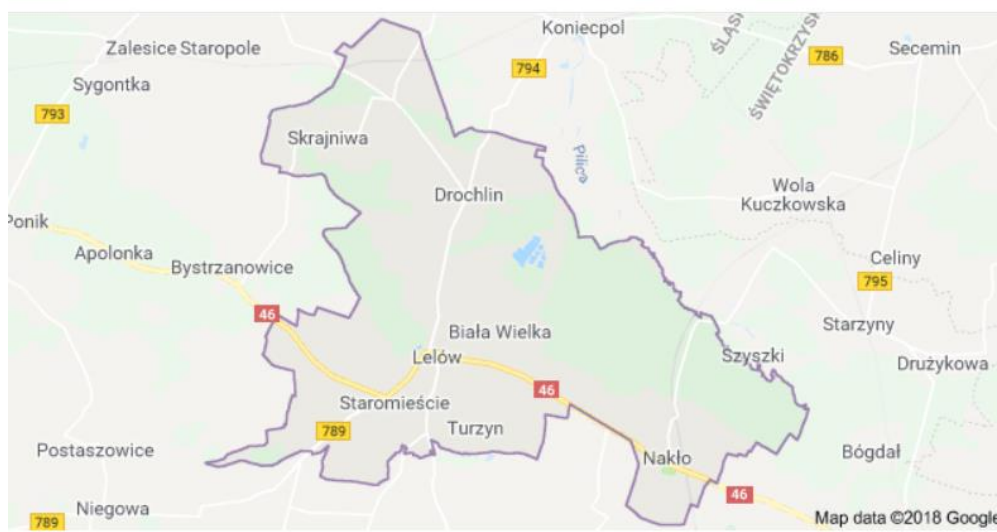
Rysunek 1. Mapa Gminy Lelów.

Szczegółowa lokalizacja i inne dane dla danej lokalizacji zostały przedstawione w załączniku do PFU.